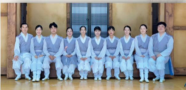
이천 거북놀이 보존회