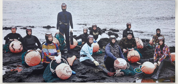
해녀중창단 용담동 어촌계