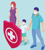
지정된 관람석 외 관람이 제한될 수 있습니다.