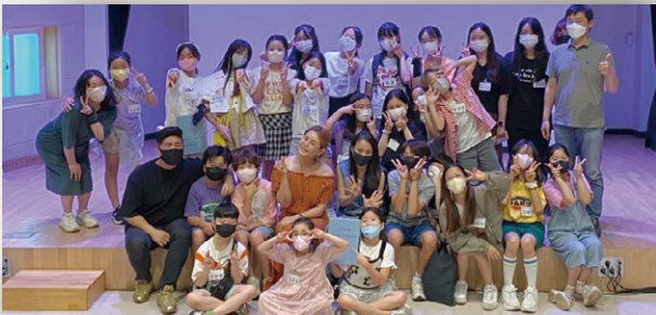
어린이합창단 제주시 뮤지컬 아카데미